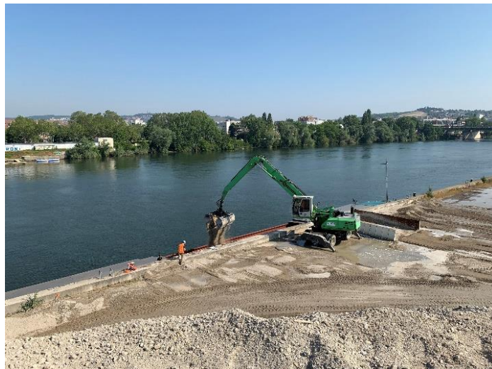
Chargement de la première péniche contenant les terres les plus polluées du chantier du CAO sur le port de Gennevilliers.